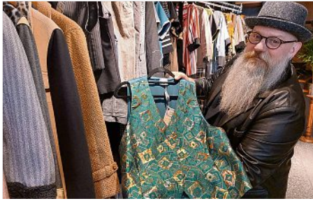
Stilechte Vintage-mode gibt es in der C&P-Modemanufaktur in der Burgstraße 1.

Im Februar und März haben zahlreiche Geschäfte den Startschuss in Meißen gewagt