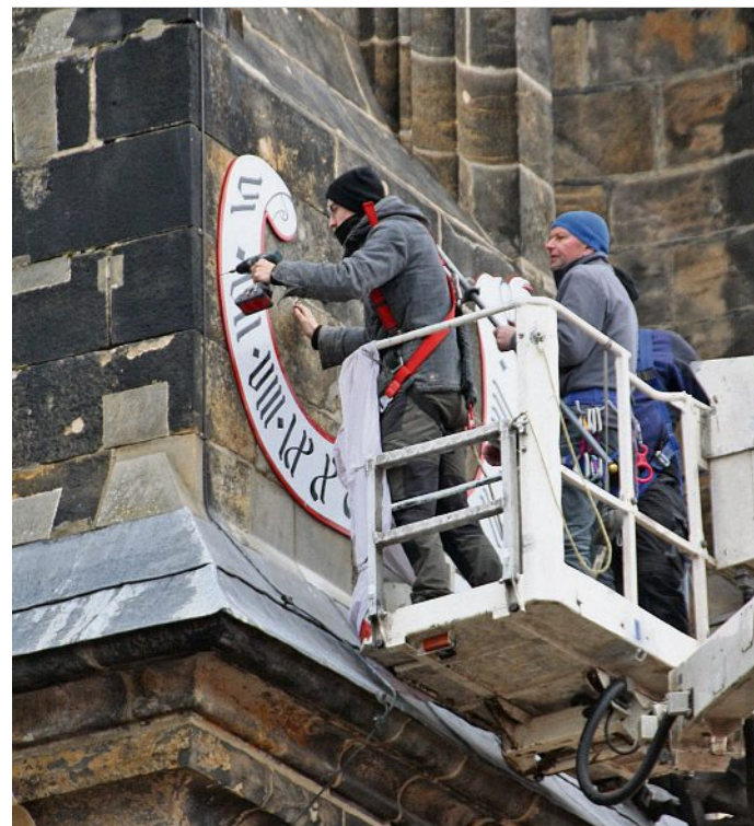
Montage der neuen Sonnenuhr.

Die exponierte Lage der Sonnenuhr hat zu einer starken, erstaunlicherweise ungleichmäßigen Verwitterung geführt. Während der linke Teil vergleichsweise gut erhalten ist, ging der Farbauftrag des rechten Teils