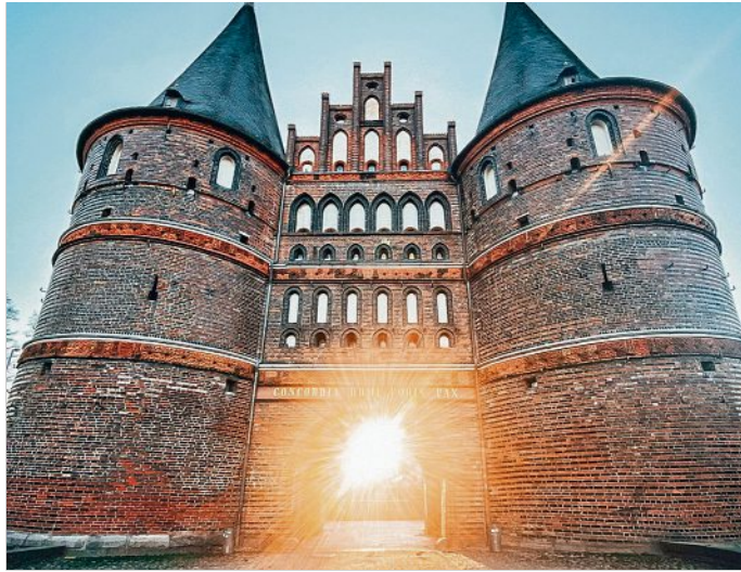
Holstentor in Lübeck

Angemessen zum Jubiläum stand der direkte Dialog mit den Verantwortungs- und Entscheidungsträgerinnen des Bundes und der Länder im Fokus des Treffens. Ziel ist es, auch in der bundespolitischen Debatte einen Appell zu formulieren – für eine weiterführende behutsame und am Menschen orientierte Stadtentwicklung, für lebensnahe Lösungen in Sachen Klimagerechtigkeit und Mobilitätswende und nicht zuletzt für den Erhalt und die Pflege der Baukultur als zentrales Fundament für die Bewältigung bestehender und zukünftiger Herausforderungen. Dazu verabschiedeten die Mitgliedstädte ihre „Berliner Erklärung zum 23. März 2023“. Neben Bekenntnissen zu Klimagerechtigkeit und Mobilitätswende enthält das Papier konkrete Forderungen an den Bund, wie eine größere Flexibilität in Sachen Städtebauförderung, einem ganzheitlichen Bewusstsein für bauliche Themen oder die Eindämmung von Bodenspekulation,