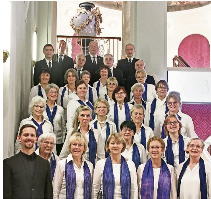
Am 29. April um 19.30 Uhr in der Schauhalle der Porzellanmanufaktur zu erleben: Der Chor „Blaue Schwerter e. V. Meissen“