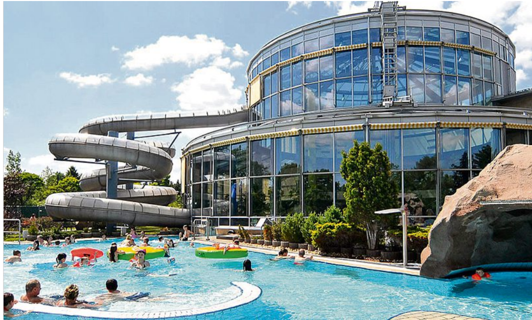
Endlich wieder komplett nutzbar: Seit Anfang März steht das Wellenspiel mit all seinen Erlebnisfeldern wieder für ungetrübten Spaß und Erholung zur Verfügung.

Besucher, vor allem Stammgäste, der Meißner Freizeiteinrichtung „Wellenspiel“, schätzen insbesondere die positive Wirkung der Sauna auf den ganzen Körper und besonders auf das Immunsystem. Wie wissenschaftliche Studien ergeben haben, leiden regelmäßige Saunagänger seltener unter Erkältungen. Grund hierfür ist vor allem das Wechselspiel zwischen Wärme und Kälte beim Saunabaden. Neben der Haut werden so hauptsächlich die Schleimhäute im Nasen-Rachen-Raum auf plötzliche Temperaturveränderungen besser vorbereitet. Die Sauna wirkt sich außerdem positiv auf das Herz-Kreislauf-System aus. Wer das für sich testen will, sollte unbedingt die Mitternachtssauna im „Wellenspiel“ ausprobieren. Vor einer Sommerpause findet sie am 5. Mai noch einmal statt. Das Motto diesmal: „Nacht der Kräuter“. Genießen Sie dabei die passenden Eventaufgüsse und Kräuterdüfte. Kleine kulinarische Snacks werden dabei nicht fehlen. Plätze können online gebucht werden, aber na-