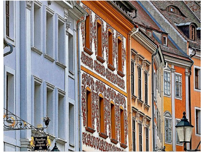
Charakteristischer Straßenzug von Görlitz