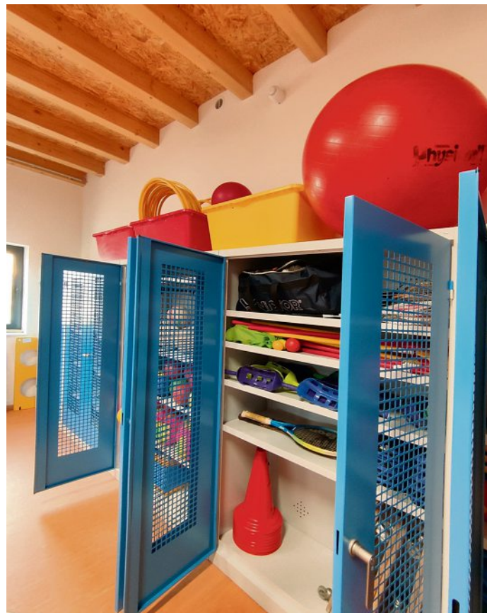
Alles an seinem Platz: die neue Turnhalle ist bereits eingeräumt