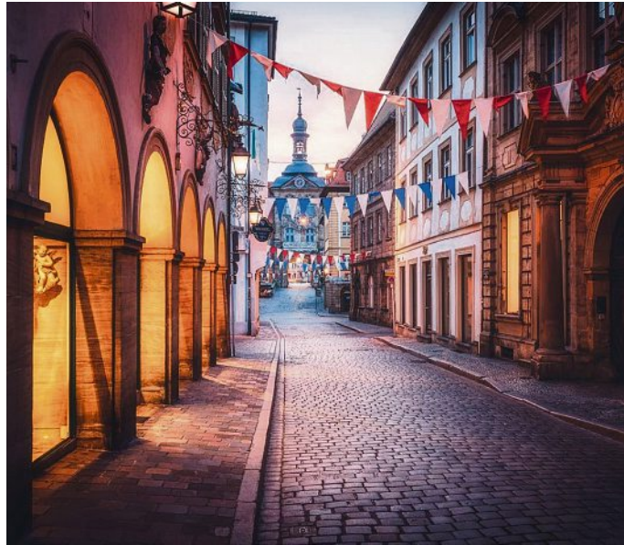
Innenstadt von Bamberg.

Um diese Forderungen zu unterstreichen, unterzeichnete Meißen Oberbürgermeister gemeinsam mit den anderen Mit-