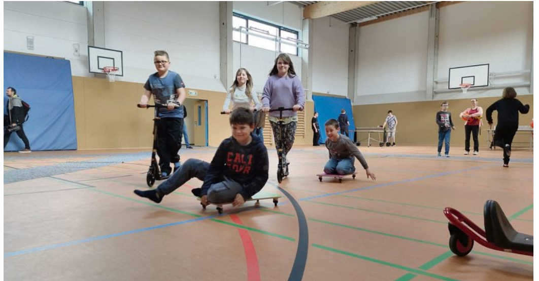
So macht Bewegung Spaß: die Schülerinnen und Schüler der Kalkbergschule testen die neue Halle

Die Sportvereine im Stadtteil profitieren ebenfalls von dem Neu-